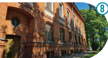
Kreenholm Supreme Government Building Kreenholmi kontorihoone Административное здание кренгольма Joala 20