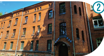
Uued kasarmud New Barracks / Новые казармы Joala 10, 12, Haigla 4, 6, Vassili Gerassimovi 3