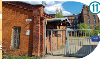
Kreenholmi manufaktuuri pääsala Kreenholm Factory Main Entrance Проходная Кренгольмской мануфактуры Joala 23c