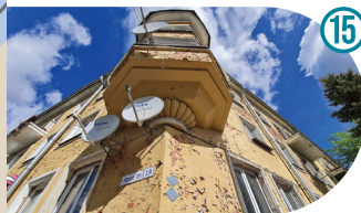
Stalinistlikud elumajad Stalinist Residential Buildings Сталинские дома Joala 3, 5, 7, 9, 11, 13, 15, Kose 1A, 3