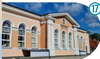
Vana turg ja rahvamaja Old Market And Community House Старый рынок и народный дом Kalda 1