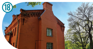
Kreenholmi arestimaja Kreenholm House Of Detention Кренгольмский арестный дом Joala 5b