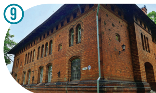
Abidirektorite elamu Assistant Directors' Dwelling Жилой дом для помощников директора Joala 24