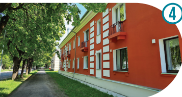
Korterelamud Koolipõik tänaval Apartment Buildings On Koolipõik Street Многоквартирные дома на улице Коопипыйк