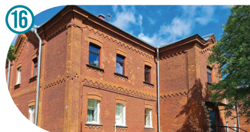
Old Workers' Barracks Vanad kasarmud Старые казармы Kalda 4, 6, 8, 10