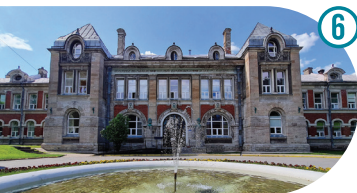
Vana haigla The Old Hospital Старая больница Haigla 1