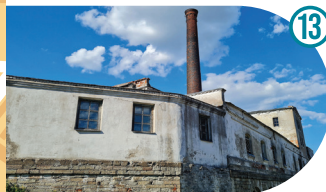
Küpsetuskoda Bakehouse Пекарня Kalda 33