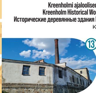
Kreenholmi ajaloolised puitalamud Kreenholm Historical Wooden Houses Исторические деревянные здания Кренгольма Kose 4, 6, 8