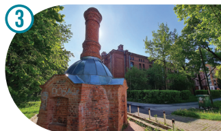
Nn prükipõletusahi The So-Called Garbage Furnace Так называемая мусоросжигательная печь