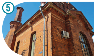
Vana sünnitusmaja Old Maternity Hospital Старый роддом Haigla 3