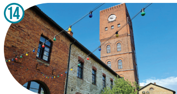
Water and Clock Tower Vee- ja kellatorn Водонапорная башня с часами Kose 12